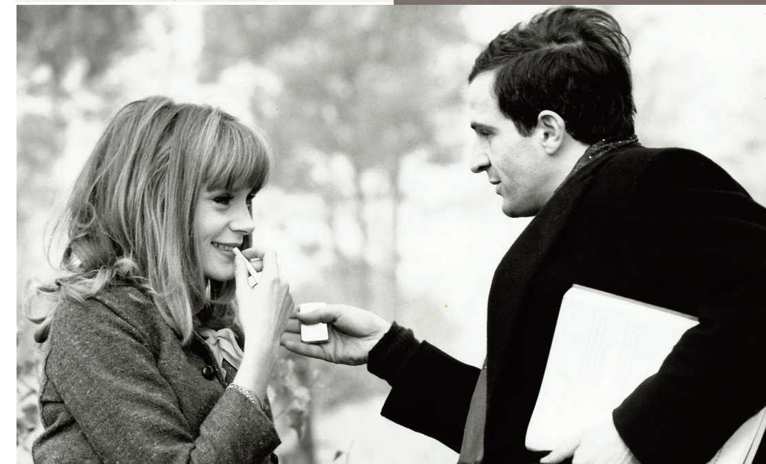
Truffaut : "l'homme qui aimait les femmes", avec Françoise Dorleac sur le tournage de La Peau douce , 1964