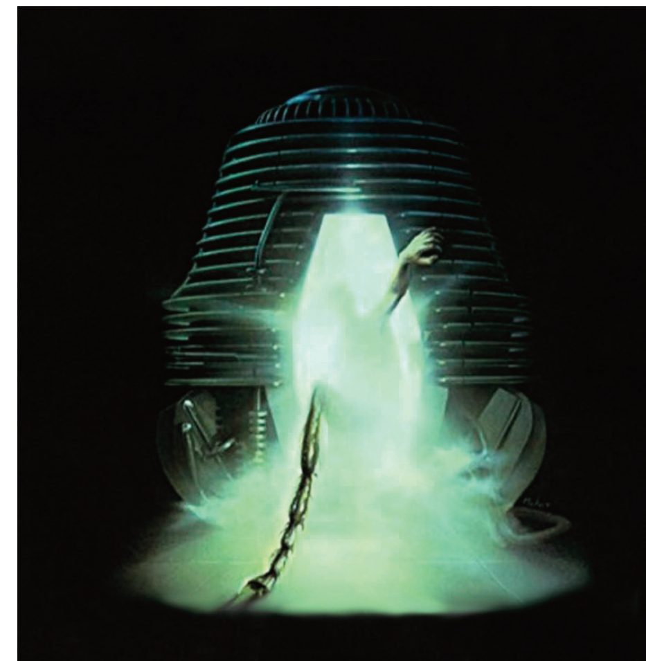
La Mouche David Cronenberg