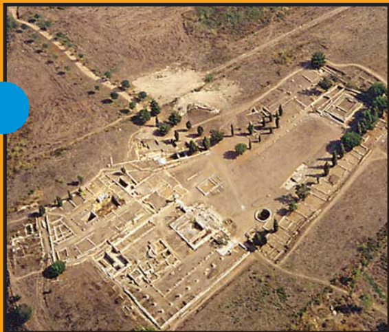
Vue aérienne du site antique

La ville évoluera jusqu'au Bas Empire, notamment à travers la modification du plan de certaines constructions, comme l'occultation des espaces situés entre les colonnes, changeant ainsi la fonction de l'espace. Le poisson et l' olla gravés sur l'un des blocs maçonnés du portique sud représentent peut-être l'une des premières manifestations chrétiennes. Si en 596, une lettre du pape Grégoire le Grand, montre qu'Aleria disposait d'un évêque, aucune cathédrale primitive n'a encore été découverte à ce jour.