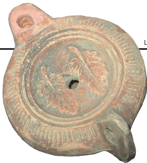
Lampe à huile