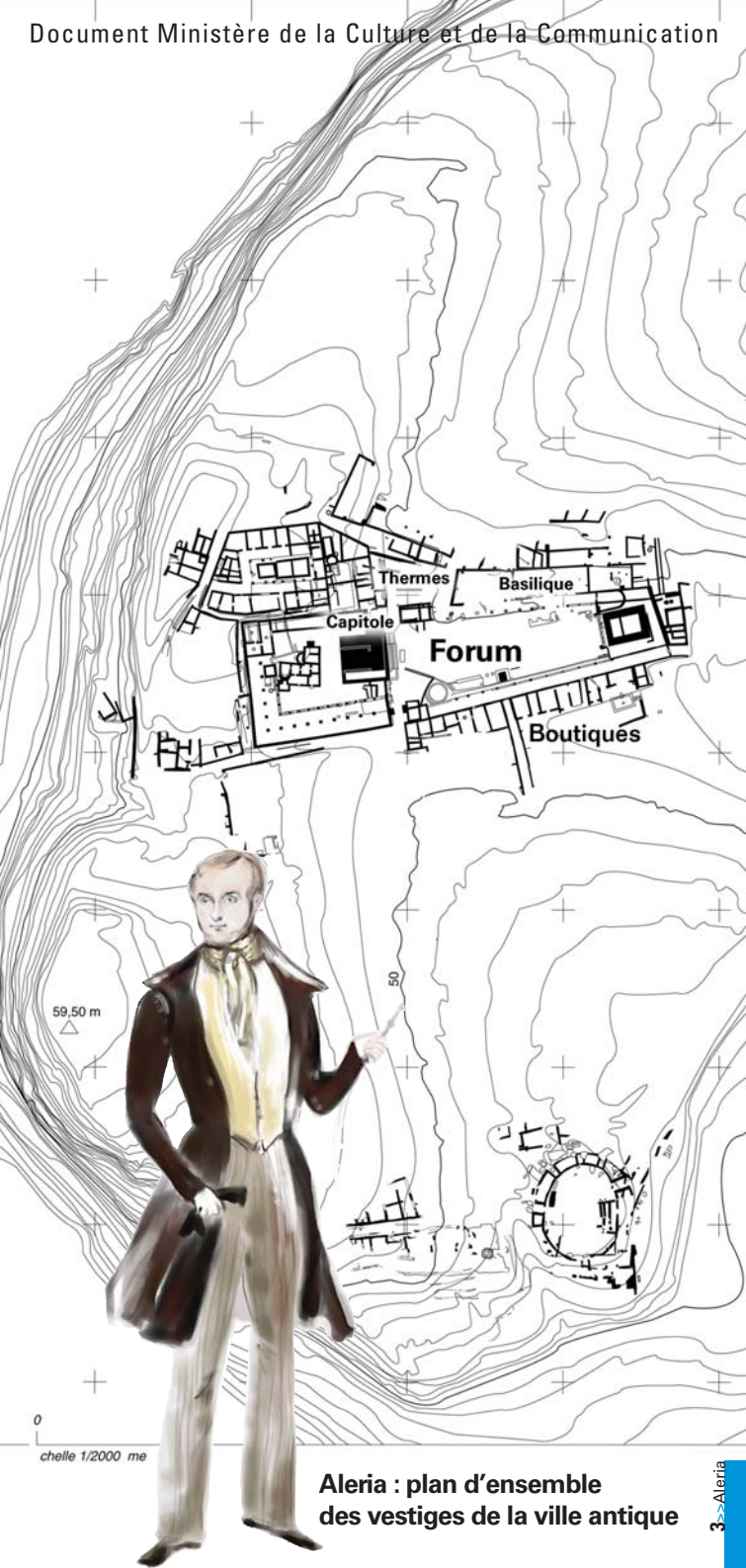
Aleria : plan d'ensemble des vestiges de la ville antique