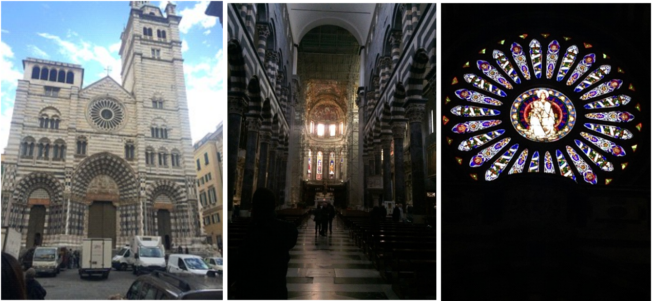
Cattedrale San Lorenzo

Dopo siamo andati mangiare un gelato e siamo tornati all'albergo.