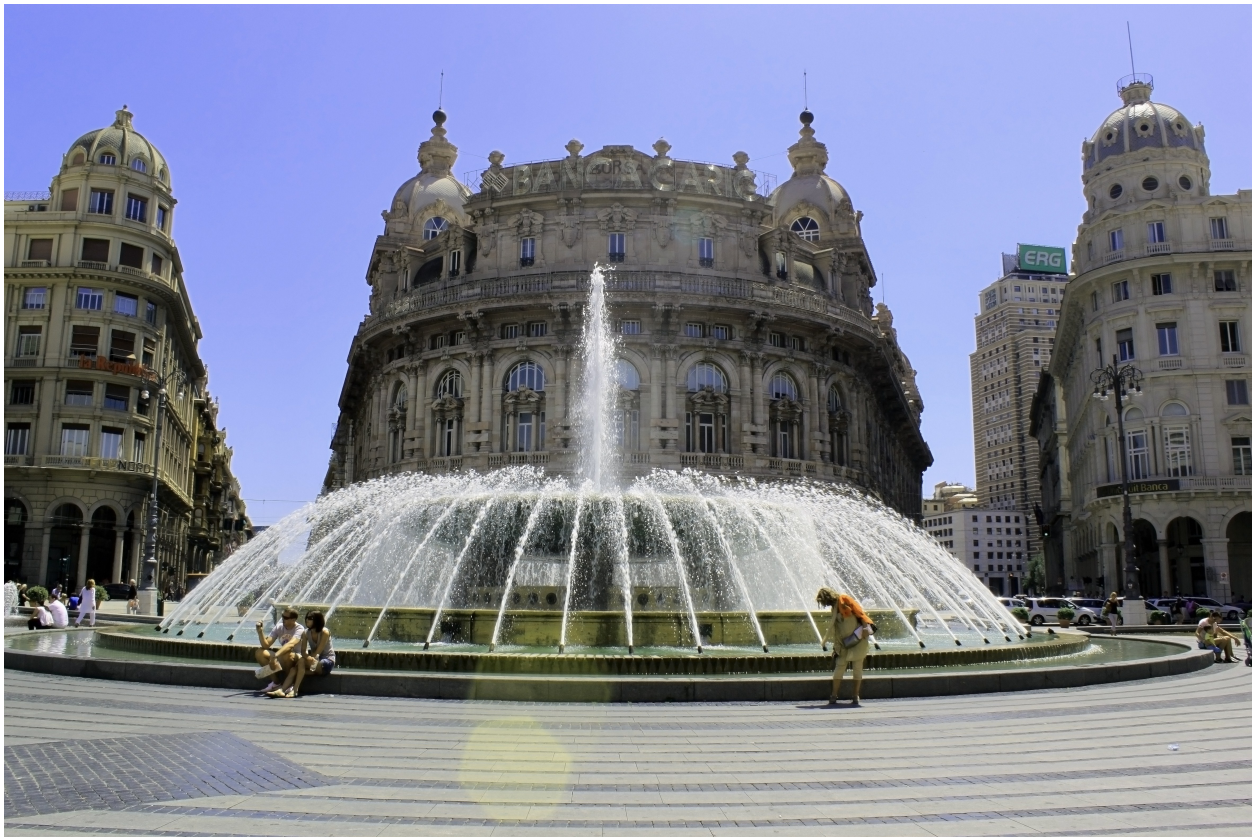
Piazza de Ferrari