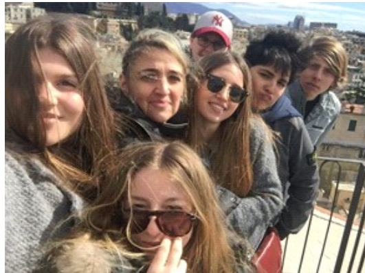
Il Palazzo Doria