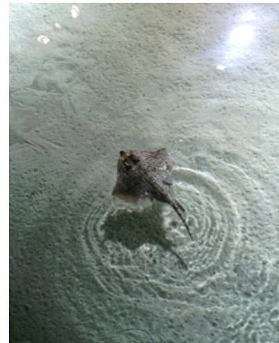
Aquario di Genova