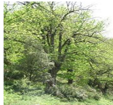
Châtaignier, castagnu, Castanea sativa Mill