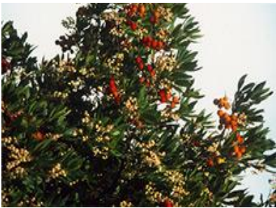
Arbousier, arbitru, Arbutus unedo L.