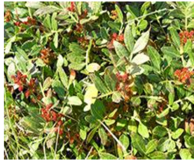
Lentisque, listincu, macchione, Pistacia lentiscus L.