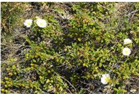
Ciste à feuilles de sauge, mucchju biancu,